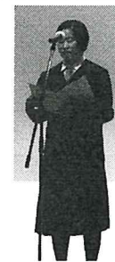
実行委員長あいさつ