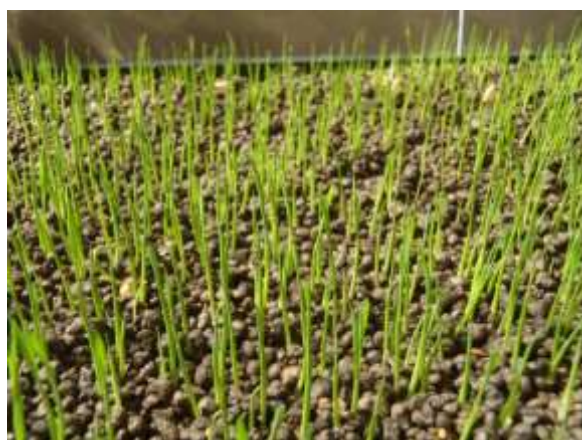
芽が出始めました！！