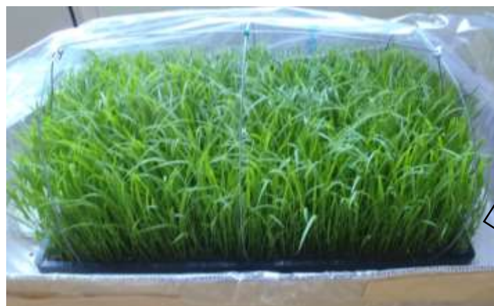
芽が出てから10日で、こんなに大きくなりました！