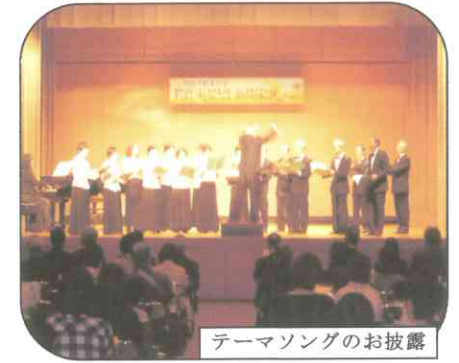
テーマソングのお披露

新庄市の次代を担う子どもたちの人間性を豊かに育てていくため、家庭・地域・学校が連携し、市民が一丸となってより良い教育環境を築きあげることを期する日として設けられています。イベント会場には、子どもたちのために、いろいろなブースがあってとても楽しそうでした。