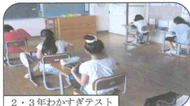
2・3年わかすぎテスト