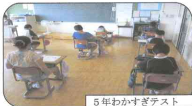
5年わかすぎテスト

国語A・算数A(A問題は知識)、算数B(B問題は活用)の正答率は県平均、全国平均を上回っています。しかし、国語Bは平均より低いという結果でした。国語の長文を読んで内容を理解して解く、記述式の問題に空欄が多かったのです。今後の課題として取り組んでいきます。