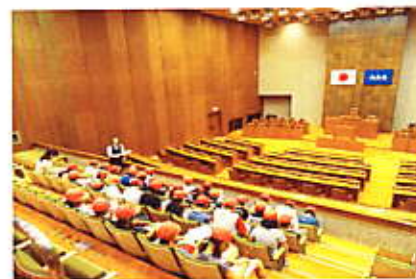
(4年生 県議会議事堂)

6月下旬から7月は、各学年とも体験学習や校外学習が充実しています。1年生は新庄駅を見学して、ゆめりあにある「も