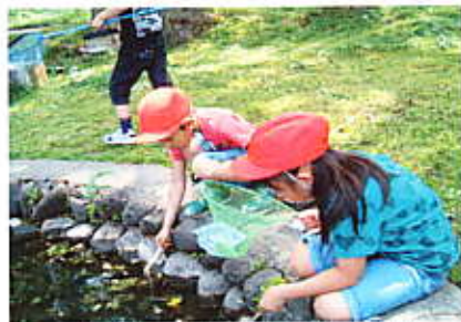
(2年生 最上公園心字池)

がみ体験館」でキーホルダーをつくりました。そして、JRにて新庄駅から泉田駅まで乗車体験をして帰ってきました。2年生は、「ふるさと歴史センター」を見学して、最