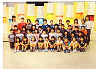
(4年生 NHK 山形放送局)

泊学習を行いました。野外炊飯やテント泊、ナイトハイキングでの蛍観察、うどんやピザづくりなど仲間と共に自然体験を満喫しました。見学や体験、仲間との活動などを通して、