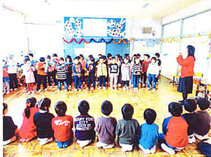
「歌と鍵盤ハーモニカによる合奏」