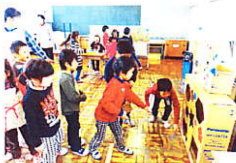
「どんぐりロケット」